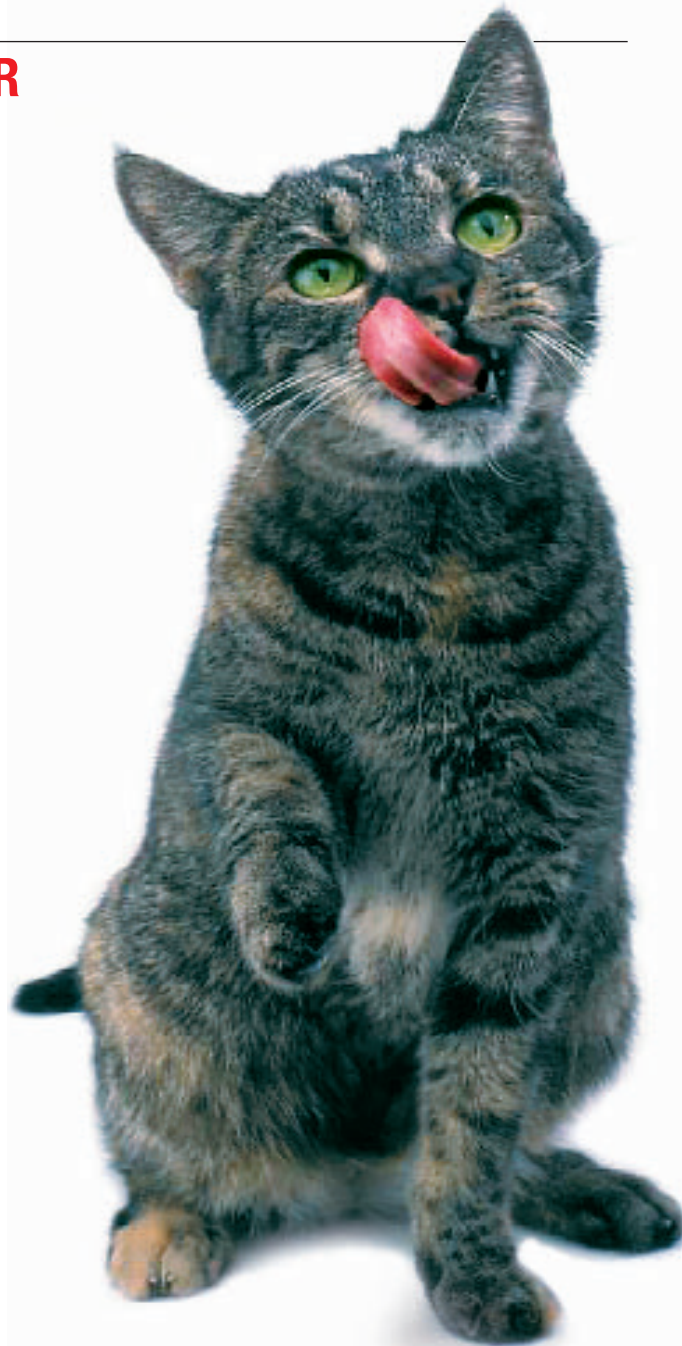
Katzennahrung: Der wichtigste Energiespender im Futter ist Fett

Für die Zahnreinigung ist Trockenfutter hingegen gut. Wanner empfiehlt deshalb,